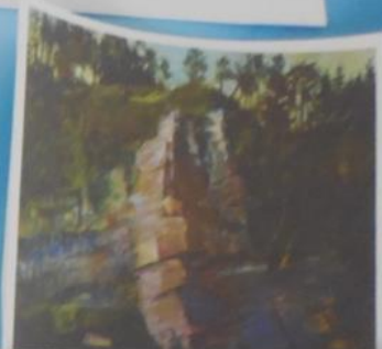
Алексей Кузьмич Денисов-Уральский. «Ветряной камень на Вишере». 1889 г.

Задание: Среди картин отбери только пейзажи, что их объединяет? Какие картины лишние? К каким жанрам относятся?