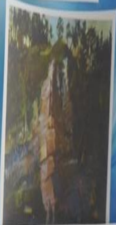
Алексей Кузьмич Денисов-Уральский. «Ветряной камень на Вишере», 1889 г.