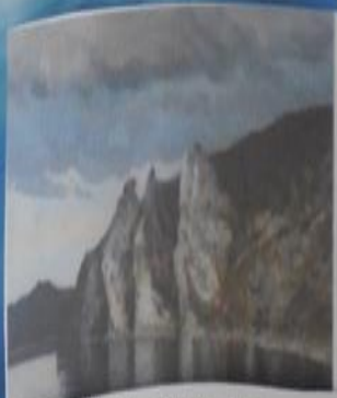
Дмитрий Крель . «Скалы», 2011г.