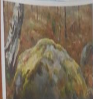
Алексей Кузьмич Денисов-Уральский. «В лесу», 1886г.

Задание: Среди картин отбери только пейзажи, что их объединяет? Какие картины лишние? К каким жанрам относятся?