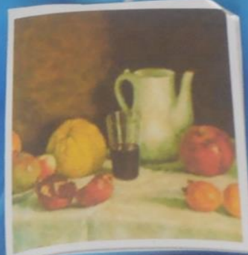
И. Машков "Натюрморт" (1930)