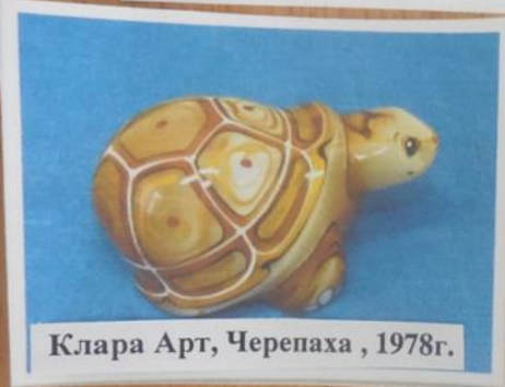
Клара Арт, Черепаха , 1978г.

Задание: Найди правильную тень статуэтки.