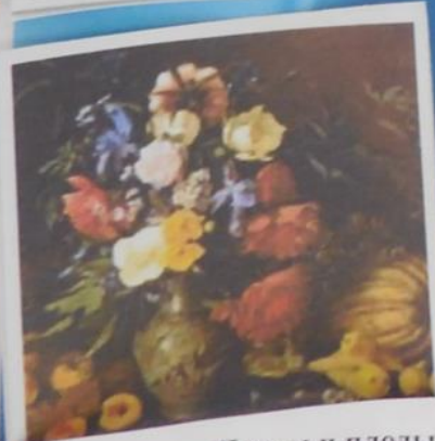
Хруцкий Иван , Цветы и плоды.1954г

Задание: Среди картин отбери только пейзажи, что их объединяет? Какие картины лишние? К каким жанрам относятся?