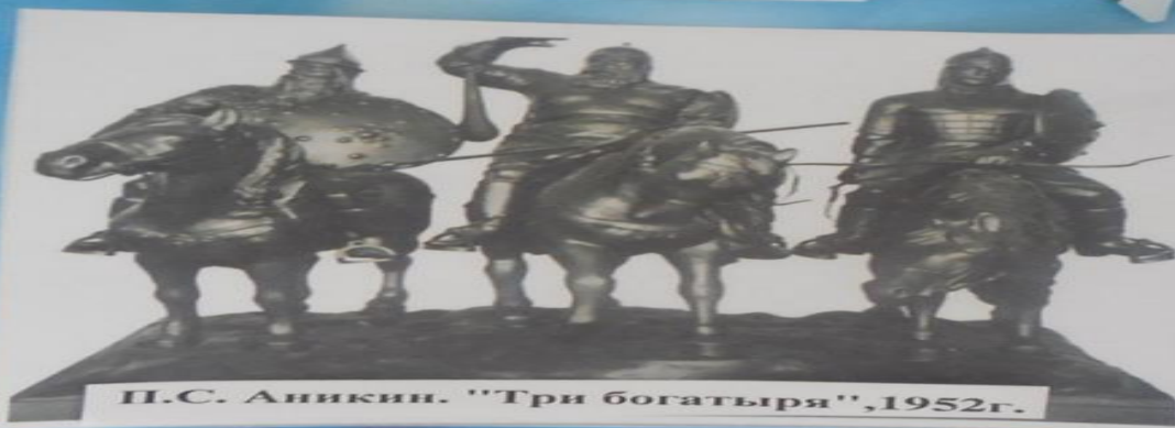
П.С. Аникин. "Три богатыря", 1952г.