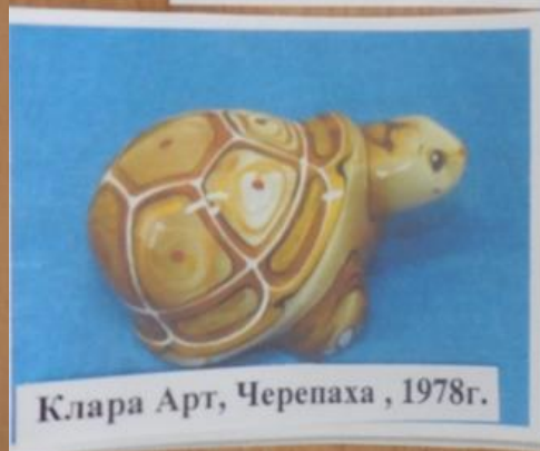
Клара Арт, Черепаха , 1978г.

Задание: Найди правильную тень статуэтки.