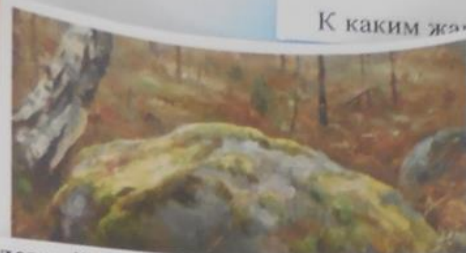
Алексей Кузьмич Денисов-Уральский. «В лесу», 1886г.