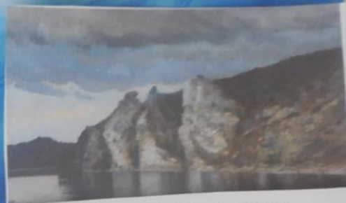
Дмитрий Крель . «Скалы», 2011г.